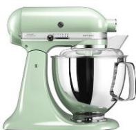
פיסטוק - EPT