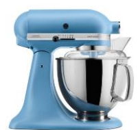
קטיפה כחולה - EVB