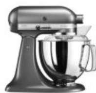
פנינה כסופה - EMS