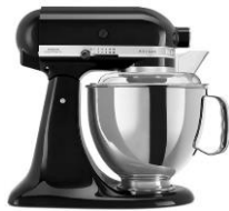
שחור - EOB