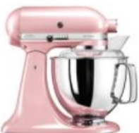
ורוד משי - ESP