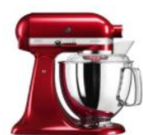
אדום תפוח - ECA