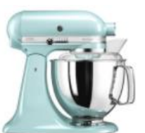
טורקיז - EIC