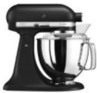
שחור מט - EBK