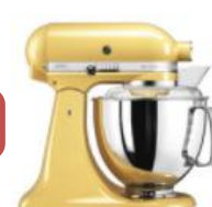
צהוב - EMY