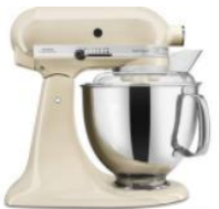
שקד - EAC