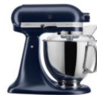
כחול עמוק - EIB