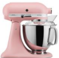
ורוד בייבי - EDR