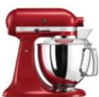
אדום - EER