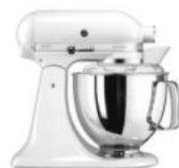
לבן - EWH