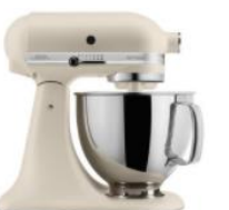
לאטה - EFL