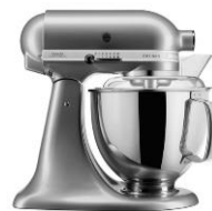
כסף - ECU